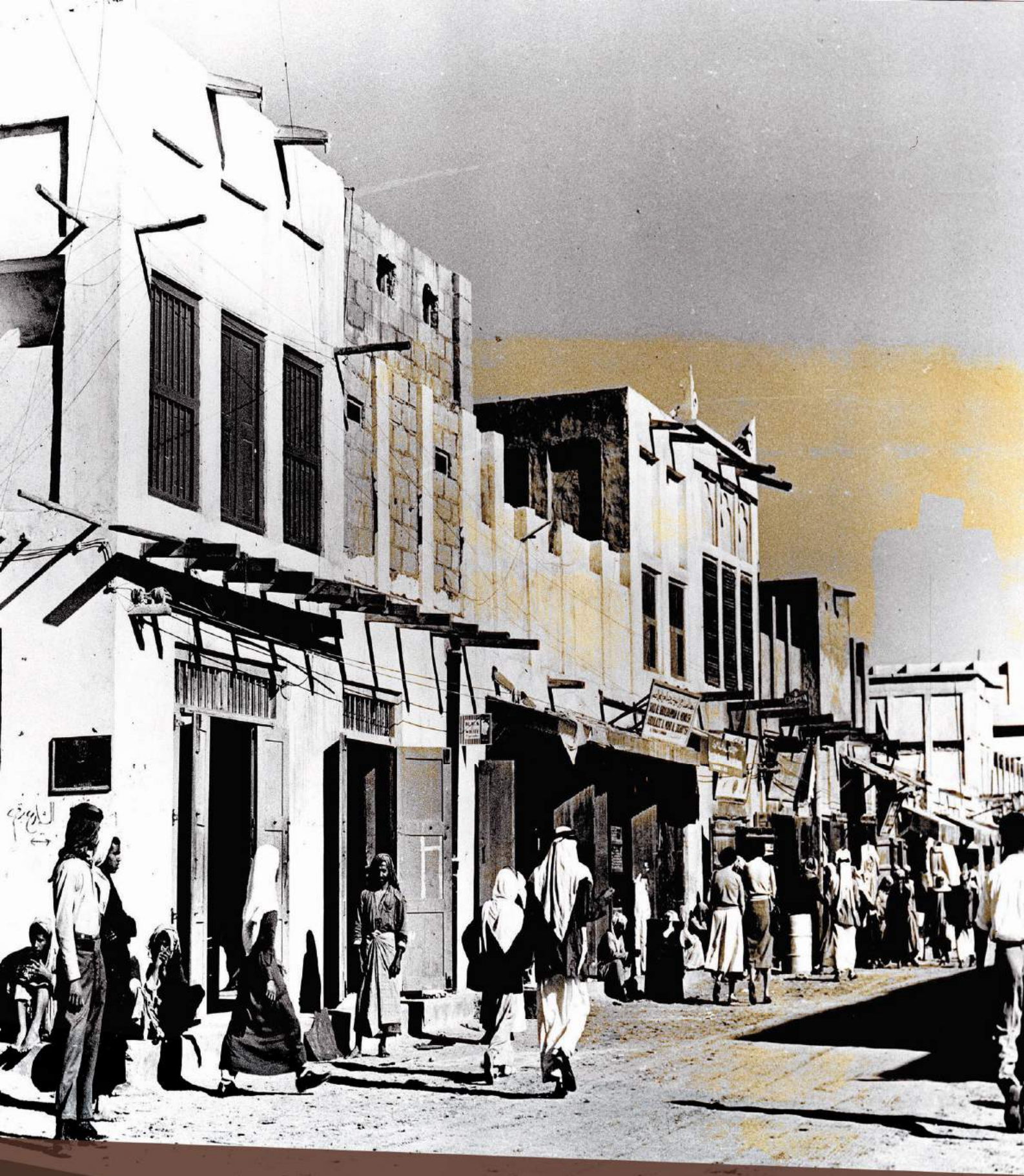
المتسوقون أسفل شارع الملك سعود في الخبر 25 مايو 1954م

SHOPPERS STROLLING DOWN KING SAUD STREET AL-KHOBAR