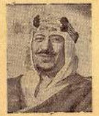
ما زال مواكب الحفاوة

والتكريم نظام بنائية قدوم حضرة صاحب السمو الملكي ولي العهد المظلم في هذه المنطقة وقد احتفل اليوم السبت طلاب المدارس واساتذتهم بزيارة ولي العهد المظلم حارس نهضة العلم وراعي راية في الساعة العاشرة مساءً أشرف موكب سموه على مدرسة الهدى حيث يتألف موكب الطلاب في ساحة المدرسة ليشتركهم عدد كثير من المدعوين من كبار الموظفين والعلماء وعدد من عائلات طلبة الشعب وكانت جموع كبيرة قد احتشدت على جانب الطريق تحي موكب سموه حفظه الله وعندما أشرقت سموه هتفت الفروع الكبيرة بجاءة سموه وبدن أن الخنفسوة مكة من صدر هذا الحفل تقدم أحد الطلاب بسلامة بعض آيات من الذكر الحكيم ثم تقدم مدير المدرسة بكلمة الافتتاح أعقبه طلاب المدرسة بقصيد الاستقبال ثم تحدث الشيخ عبدالعزیز التركي معتمد المعارف في هذا المنطقة عن الرياسة التي يتفضل بها حضرة صاحب السمو ولي العهد المظلم دأماً على العلم والجاه والمجد التي يبذلها سموه لما في سبيل رفع مستوى الثقافة ونشر التعلم وتبنيه بجمع أفراد الشعب بمختلف طبقاته وشكر سموه المظلم على تزيينه هذا الحفل ثم قدمت جموعة من الطلاب موشحاً تتخلل يدع عنوانه حروف المهاجرين فيه