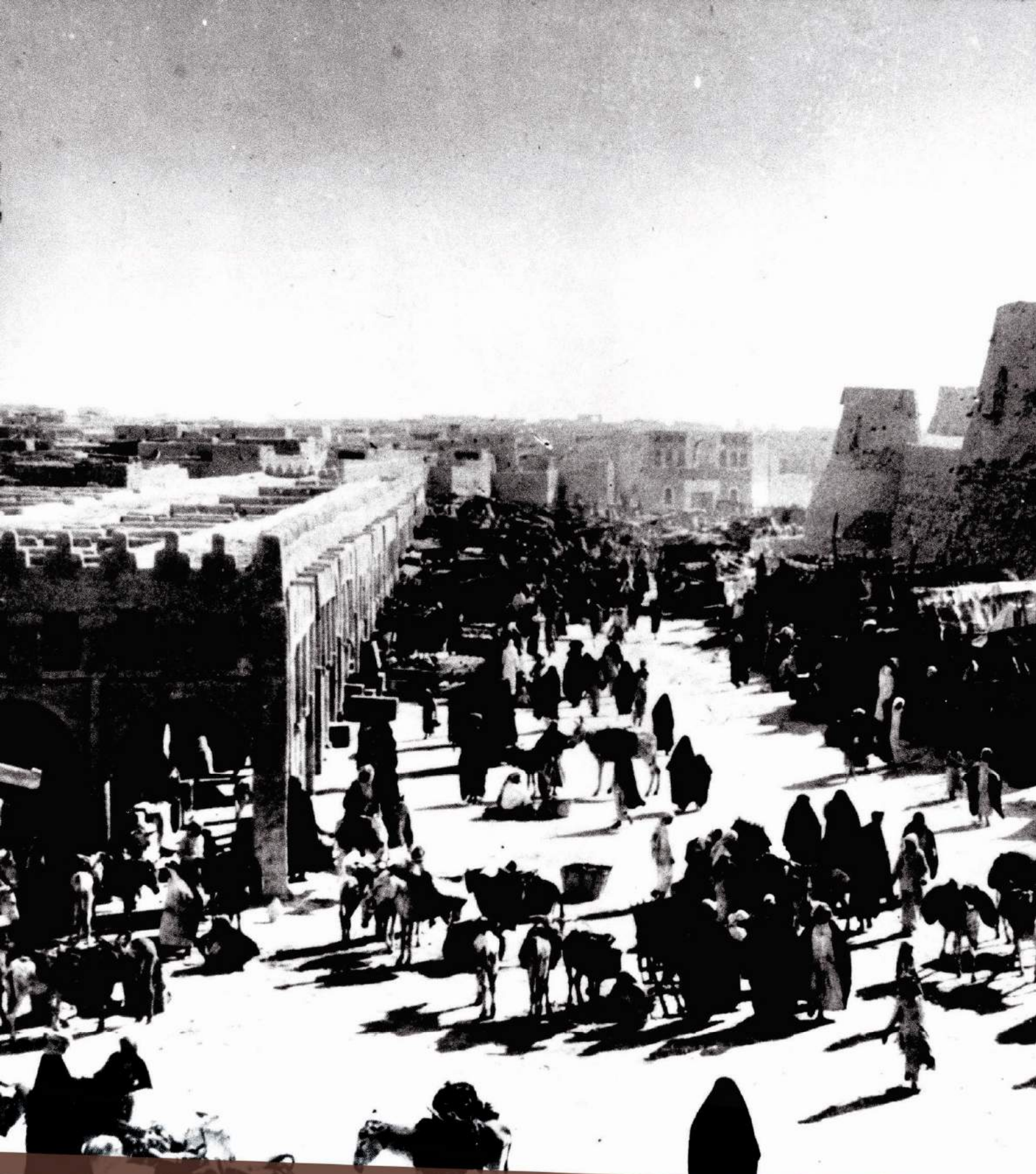
الشارع الرئيسي لمدينة الهفوف عام 1935م