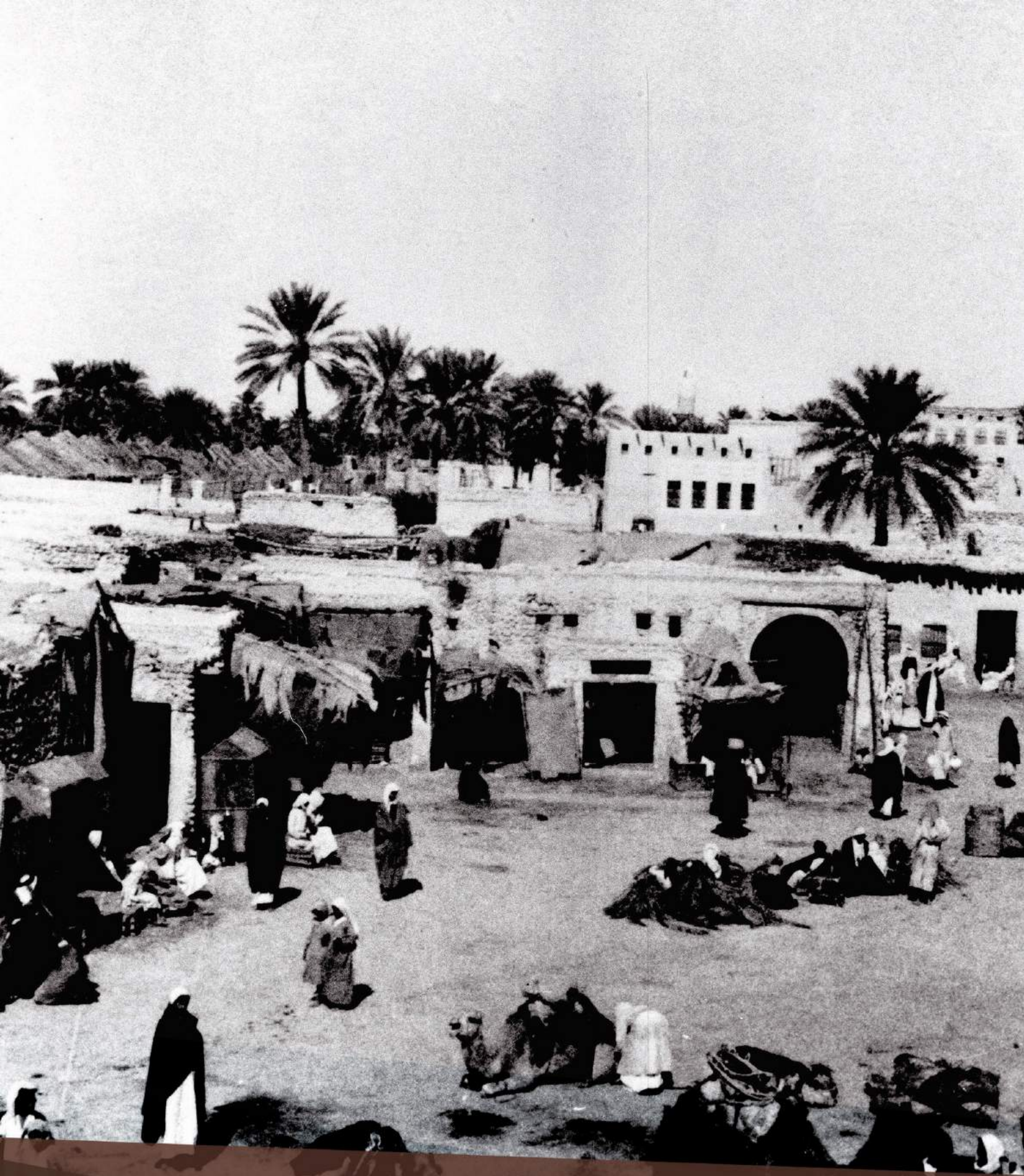
سوق القطيف من نافذة بيت القصيبي يناير 1934م

THE SUQ (MARKET) OF AL-QATIF FROM AL-GOSAIBI WINDOW