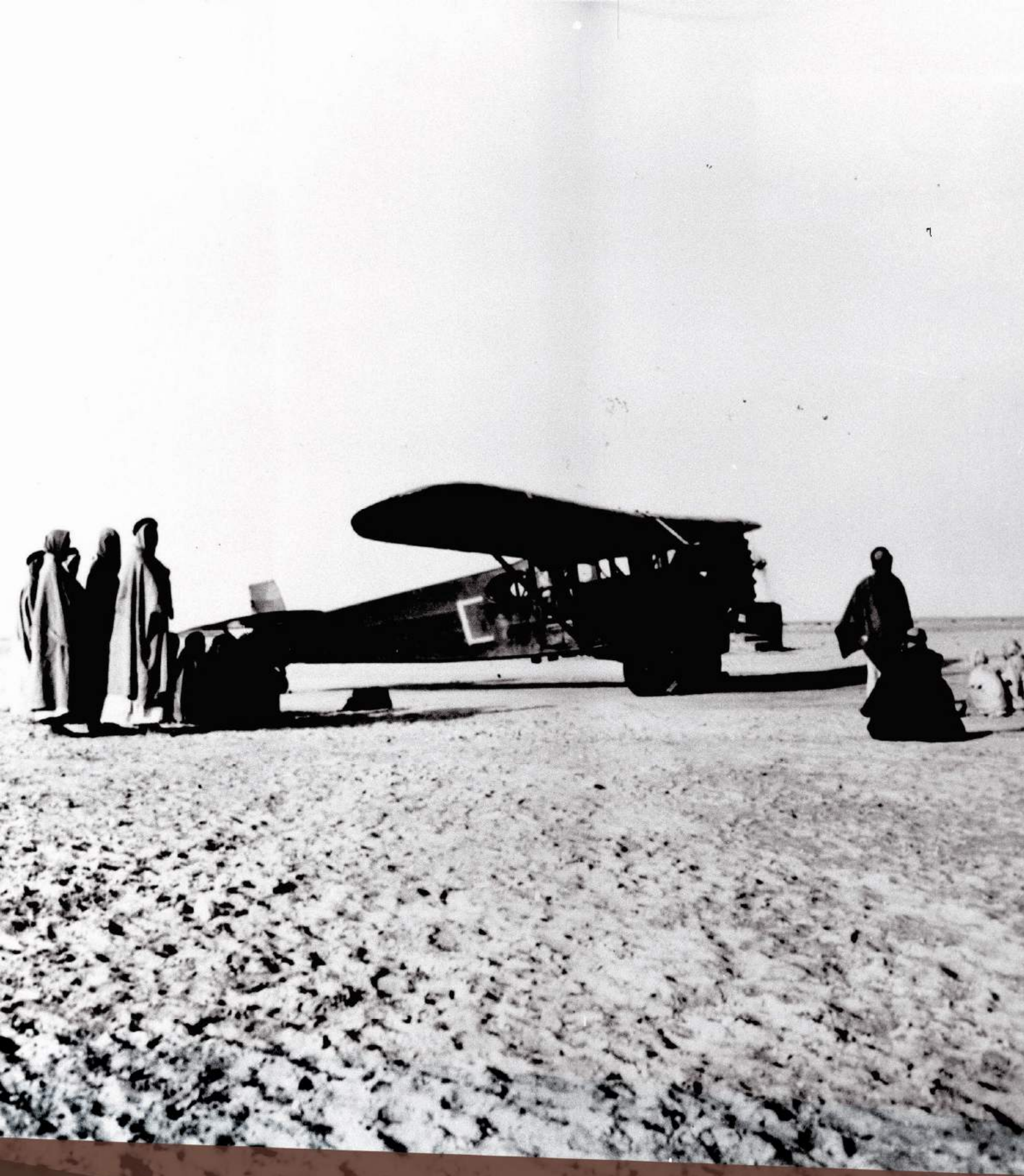
طائرة فيرتشايلد تهبط في الجبيل عام 1934م