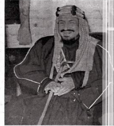
الملك عبدالعزيز بن آل سعود - يومنا الجميل أيام الوجوه

أخاضت الأقدام وسكتب الأدياء والأورغون كثيراً من جلاله الفيصل آل سعود ، ولكن شخصية مثل شخصية المعالي الممدى ، لا تقوى عشرات المؤلفات والمقالات حقها من البحث والتحليل ، لأن الأزياء والنواحي المنظمة التي تنوعت في هذه الشخصية ليس من السهل إضباها بمحا ، ويقدر ما يكتبه الكتابون فيها ، يعبر القارئ بأن كلامهم يسير في اتجاه غير الذي يسير فيه الآخر وإن كلامهم يسير مع آراء وعواطف لا يعبر عنها الآخر مع ان الشخصية واحدة ، والمزايا واحدة ولكن السور هو سر المنظمة في هذه المزايا ، وفي هذه الشخصية .