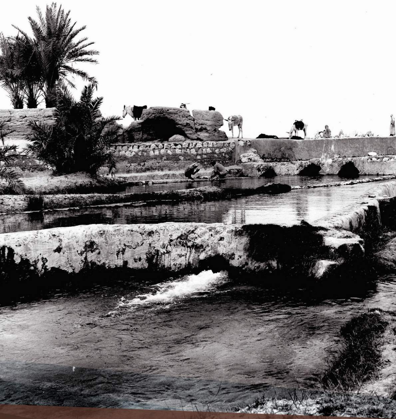
عين أم سبعة في الهفوف من أكبر وأشهر الينابيع في الأحساء عام 1949م

AIN UMM SAB'AH IN HOFUF THE MOST FAMOUS SPRING IN AL HASA