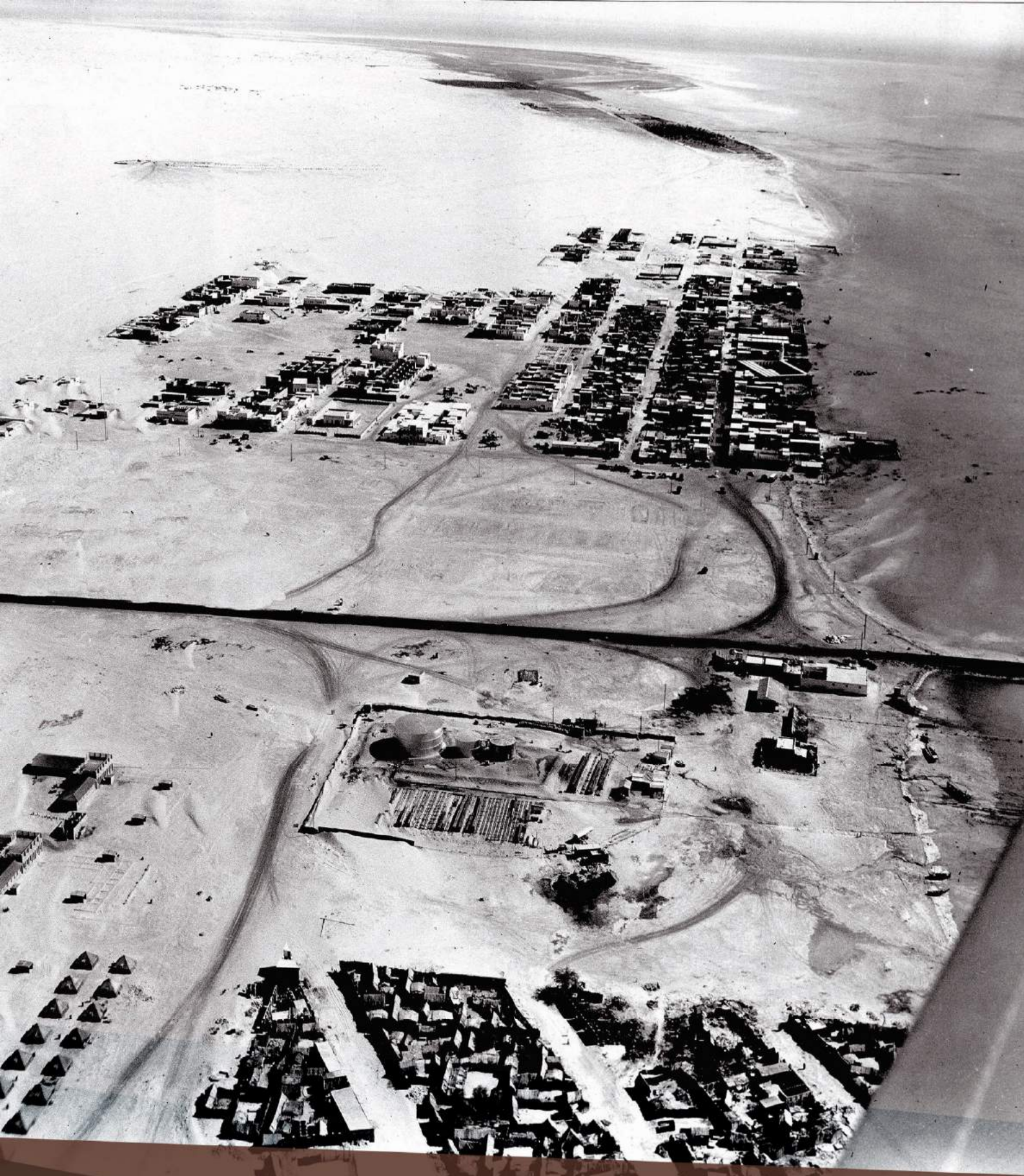
صورة جوية من الخبر 6 يونيو 1950م