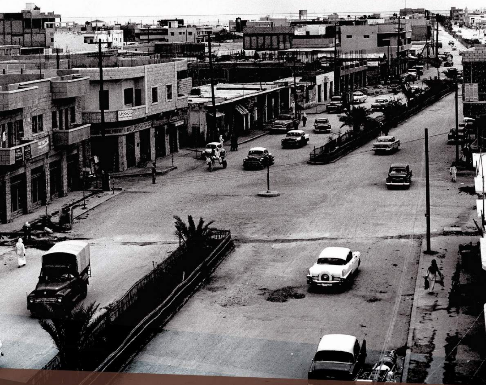
منظر لأحد شوارع الدمام مارس 1960م

STREET SCENE IN DAMMAM , EASTERN PROVINCE