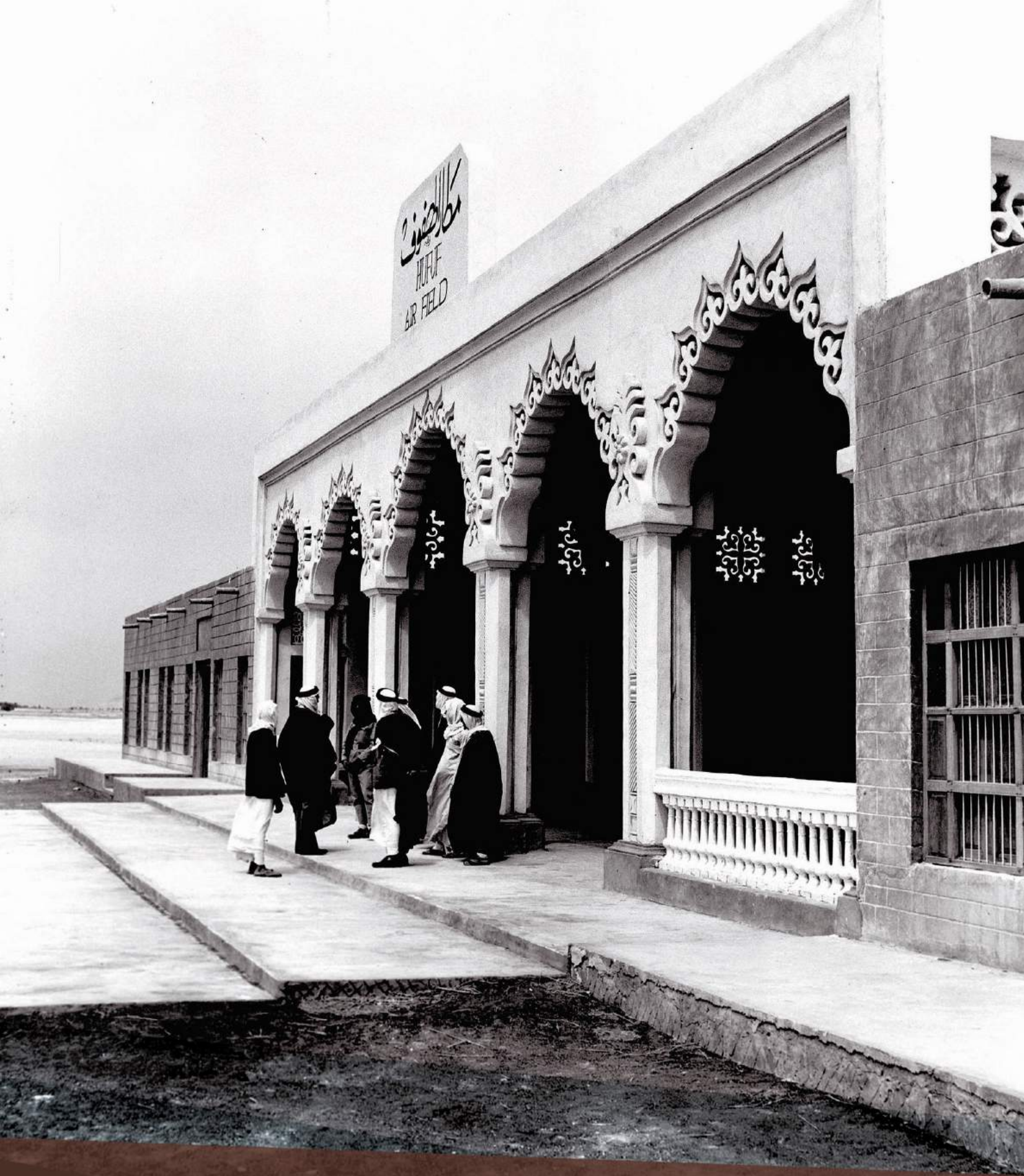
مدخل مطار الهفوف 1949م